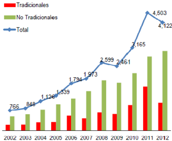
Grafico 3: Exportaciones agrícolas del Perú, millones de dólares

El sector pesquero peruano, que también ha visto aumentar sus exportaciones desde la última década, podría ser otro beneficiado. Estas aumentaron de 1,056 millones de dólares a 3,302 millones del 2002 al 2012 (Según el documento: Presentación: “¿Por qué invertir en el Perú?”, de Proinversion).