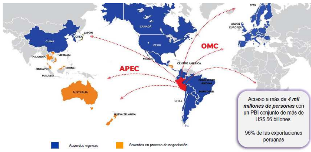
Grafico 2: Acuerdos comerciales del Perú, vigentes y en proceso de negociación